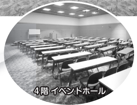
4階 イベントホール